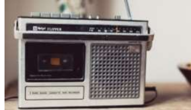
Gambar 26. Radio FM tahun 1960-an

Scene 32 dibuka dengan gambar sebuah radio dengan tulisan Djakarta, 1965. Hal ini menjadi penanda bahwa kejadian dalam scene ini berlangsung sepuluh tahun setelah pertemuan terakhir Bayu dengan Danti. Properti radio menjadi salah satu penanda latar waktu pada scene 32 , hal ini sekaligus menjadi pembeda dengan scene 26 yang juga memperlihatkan properti radio. Pada scene 32 memperlihatkan radio FM dengan merek Sony , dimana radio ini dapat memutar musik dari kaset pita. Radio FM baru rampung digunakan pada akhir tahun 1960-an FM dan diakui sebagai sistem unggulan di berbagai bidang komunikasi pada masa itu.