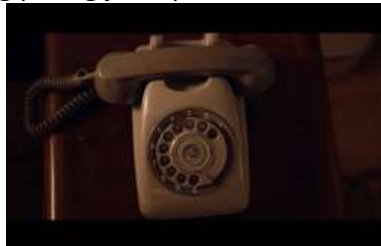
Gambar 20. Properti Telepon Putar

Jenis radio yang terdapat pada scene 26 adalah radio nirom yang digunakan sejak zaman kolonial Belanda. Nirom merupakan singkatan dari Nederlandsch- Indhische radio Omroep Maatschappij yang merupakan stasiun radio milik Belanda dan selalu menyiarkan berita dengan bahasa Belanda. Namun sejak Indonesia merdeka stasiun radio nirom digunakan sebagai media informasi oleh masyarakat dan mengudara untuk pertama kalinya pada tahun 1930. Properti radio nirom menjadi penanda waktu kejadian tahun 1955 yang paling jelas pada scene ini.