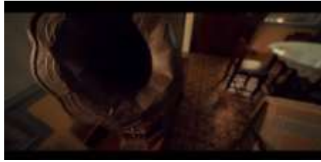
Gambar 23. Properti Gramophone

Properti pendukung pada scene ini yang menjadi penanda latar waktu tahun 1955 adalah gramophone atau alat pemutar musik yang terletak di atas meja. Gramophone merupakan alat pemutar musik dan pertama kali muncul pada tahun 1930 dan masih bertahan hingga tahun 1970-an. Gramophone adalah alat pemutar vinyl atau piringan hitam yang terbuat dari kotak kayu.