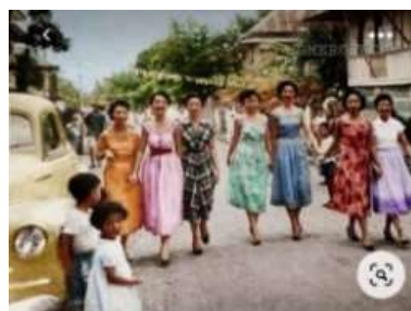
Gambar 4. Rias & Busana tahun 50-an