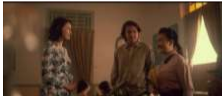
Gambar 24. Scene 32 (01:02:02)

Sepuluh tahun berlalu sejak kepergian Senda dan Danti yang secara tiba-tiba dari kosan Cik Mei. Sebelumnya Danti berjanji bertemu dengan Bayu untuk terakhir kalinya di bawah pohon kamboja. Namun Danti tidak pernah datang, karena ia sedang bertengkar hebat dengan Sena. Danti pergi meninggalkan kosan karena Sena tiba-tiba terkena stroke . Bayu kembali bertemu dengan Danti saat ada acara partai di rumah Cik Mei.