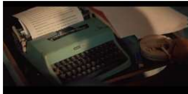
Gambar 7. Properti Mesin tik