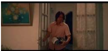
Gambar 9. Kostum dan Rias tokoh Bayu