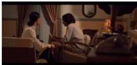
Gambar 19. Scene 26 (00:50:10)

Bayu mendapatkan surat cerai dari Lastri yang tiba-tiba pergi begitu saja dari kosan tanpa memberi tahunya. Bayu menyampaikan apa yang terjadi pada Danti. Sementara Danti sedang menunggu telepon dari Sena yang sedang berada di luar kota. Tiba-tiba telepon berdering, dan saat Danti mengangkat telepon yang ternyata dari Sena membuat Danti sedikit terkejut karena Sena mengatakan bahwa ia akan pulang malam ini dan ingin membicarakan sesuatu dengan Danti.