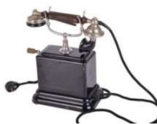
Gambar 21. Telepon Engkol tahun 1950-an