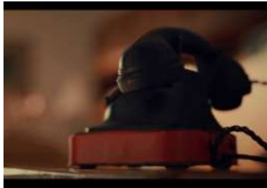
Gambar 27. Properti Telepon putar

Scene 32 dibuka dengan gambar sebuah radio dengan tulisan Djakarta, 1965. Hal ini menjadi penanda bahwa kejadian dalam scene ini berlangsung sepuluh tahun setelah pertemuan terakhir Bayu dengan Danti. Properti radio menjadi salah satu penanda latar waktu pada scene 32 , hal ini sekaligus menjadi pembeda dengan scene 26 yang juga memperlihatkan properti radio. Pada scene 32 memperlihatkan radio FM dengan merek Sony , dimana radio ini dapat memutar musik dari kaset pita. Radio FM baru rampung digunakan pada akhir tahun 1960-an FM dan diakui sebagai sistem unggulan di berbagai bidang komunikasi pada masa itu.