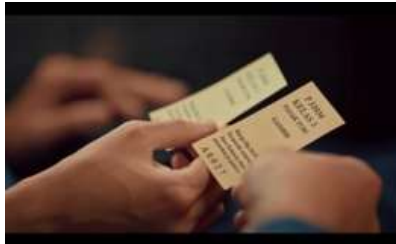
Gambar 17. Properti Tiket Kereta Api

Pada scene 23 terdapat bagian yang memperlihatkan tiket kereta yang digunakan oleh Sena dan Lastri untuk ke Surabaya. Properti tiket kereta pada adegan tersebut menjadi penanda latar waktu tahun 1955. Jenis tiket kereta yang diperlihatkan pada scene ini adalah tiket edmondson , yaitu tiket kereta api jenis pertama pada tahun 1897 di Indonesia dan masih digunakan hingga tahun 90-an. Tiket edmondson terbuat dari kertas karton dan berukuran kecil serta memiliki warna yang berbeda sesuai dengan tujuan kereta. Pada saat sekarang tiket kereta api sudah menggunakan jenis tiket boarding pass seperti tiket pesawat, dan para penumpang dapat membelinya secara online .