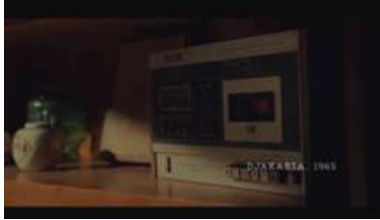
Gambar 25. Properti Radio FM