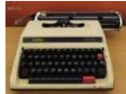
Gambar 8. Mesin Tik tahun 1955

Properti mesin tik yang digunakan Bayu, sangat mendukung dalam menggambarkan tahun 1955. Properti mesin tik, memberikan gambaran yang kuat dalam penggambaran waktu pada scene ini, karena pada tahun 1955 belum ada komputer atau alat elektronik yang digunakan untuk mengetik. Properti lainnya yang menjadi penanda periode waktu pada scene 3 adalah penggunaan rokok kretek dan juga korek api atau mancis yang sudah jarang ditemukan pada masa sekarang. Properti mesin tik dalam film Kambodja sama dengan mesin tik tahun 1955 seperti yang terlihat pada gambar 23.