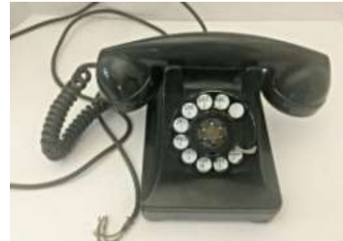
Gambar 28. Telepon Putar tahun 1960-an

Properti lain yang terlihat pada scene 32 adalah bell telephone (telepon putar) sebagai penanda tahun 1965. Penggunaan telepon putar dimulai pada tahun 1960 hingga tahun 1980-an dan kemudian digantikan dengan telepon kabel yang menggunakan tombol.