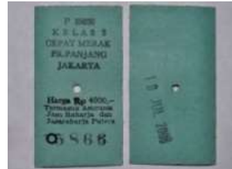
Gambar 18. Tiket Edmondson tahun 1950-an