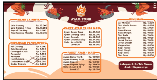
Gambar 5. Hasil Menu Board