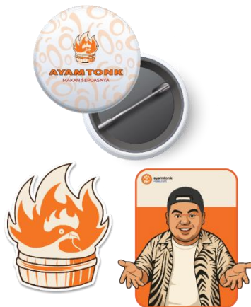
Gambar 9. Hasil Pin dan Stiker

Pin merupakan salah satu merchandise yang bisa diberikan pada konsumen serta dapat dipakai oleh karyawan sebagai atribut seragam (Anggraini, Nathalia K. 2014). Desain pin menampilkan logo Ayam tonk serta penambahan supergraphic sebagai latar belakang. Dengan demikian, pin juga merupakan alat bantu promosi yang efektif karena dapat memperkenalkan merek karena pin mudah dibawa. Stiker juga merupakan merchandise yang bisa dibagikan kepada konsumen. Stiker ini berfungsi sebagai media pengaplikasian identitas Ayam Tonk yang efektif. Stiker menampilkan logo Ayam Tonk dan karakter owner yang dibuat menarik.