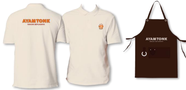
Gambar 8. Hasil Seragam dan Apron

Kaos yang mempunyai krah dipilih sebagai seragam karyawan Ayam Tonk bertujuan agar lebih casual namun tetap terlihat premium . Pemilihan warna seragam adalah putih gading dengan warna yang lembut dengan desain yang menampilkan logo serta tipografi Ayam Tonk. Seragam ini berbahan CVC pique hexagon kemudian disablon bagian depan kiri dan dibagian belakang. Apron dibuat dengan warna coklat tua dengan desain tipografi berwarna putih yang ditambahkan dibagian depan.