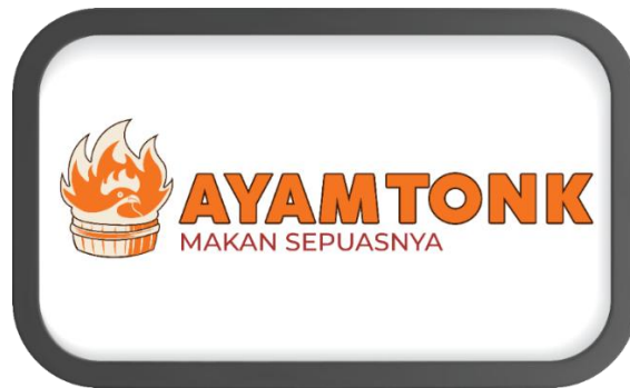
Gambar 3. Hasil Neonbox