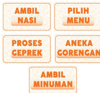
Gambar 7. Hasil Sign Board

Sign board dirancang sebagai petunjuk untuk konsumen saat proses pengambilan produk Ayam Tonk. Sign board ini berbentuk kotak dengan ukuran 25 x 15 cm yang dicetak dengan menggunakan bahan albatros. Desain yang dibuat menampilkan tipografi yang jelas dengan ditambahkan supergraphic sebagai latar belakang agar tetap mewakili usaha Ayam Tonk.