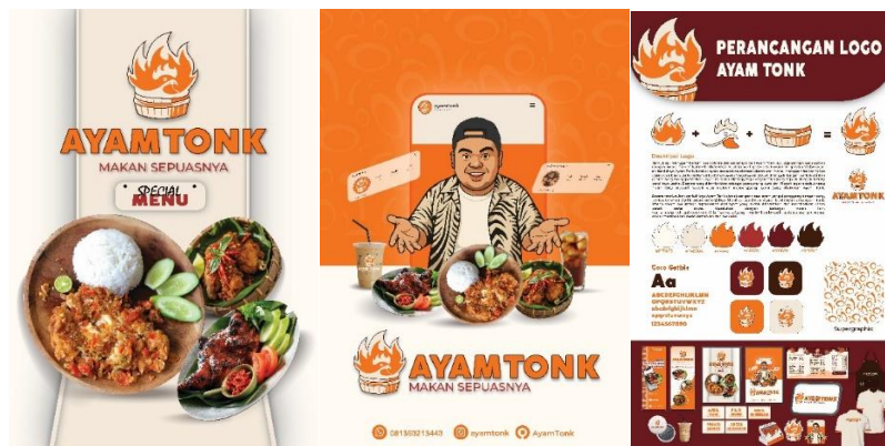
Gambar 4. Hasil Poster

Poster ayam Tonk berukuran 42 x 60 cm berbahan albatros, menampilkan foto produk, logo, visual lainnya yang mewakili usaha Ayam Tonk. Poster juga berisikan karakter dari owner Ayam Tonk yang seperti sedang menyuguhkan produknya. Konsep ini dibuat agar terlihat lebih menarik dan menumbuhkan selera terhadap produk ayam Tonk. Kemudian menghadirkan poster perancangan yang berukuran 60 x 100 cm berbahan albatros berisikan informasi rancangan logo dan bauran media.