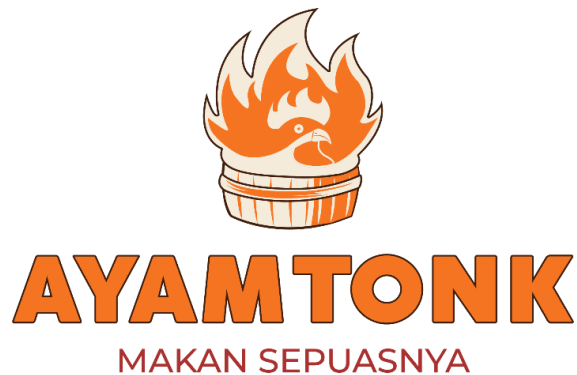
Gambar 1. Hasil Redesain Logo

2023) yang memiliki arti kehangatan dan kenyamanan, sesuai dengan brand personality usaha Ayam Tonk.