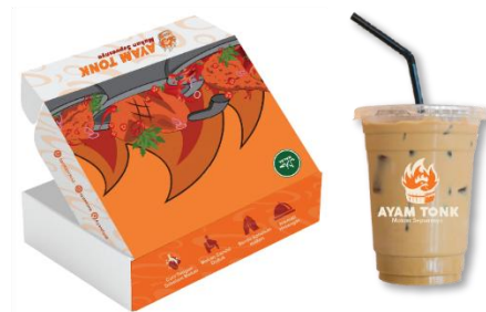
Gambar 2. Hasil Grafik Kemasan

Pada perancangan kemasan Ayam Tonk menggunakan kemasan berbentuk box dengan ukuran 18 x 10 x 5 cm untuk bagian bawah dan 20 x 12 x 5 untuk bagian atas. Bahan dari kemasan ini yaitu ivory yang sudah dilaminating, namun untuk keperluan pameran kemasan ini dibuat berbahan artpaper 260gsm yang sudah dilaminating. Kemasan ini didesain dengan warna dan visual yang mewakili usaha Ayam Tonk. Tujuan dari desain kemasan ini agar lebih terlihat premium dan aman mengingat sebelumnya Ayam Tonk memiliki desain kemasan yang berubah-ubah setiap pembelian kemasan.