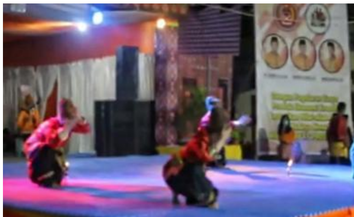
Gambar 2. Terlihat Penari Melakukan Gerak Sambah Duduk

Gerakan Sambah menjadi langkah awal yang penting dalam Tari Buai-buai , dimana sebelum penari memulai gerakan lainnya, gerakan sambah menandai awal dari rangkaian gerakan yang akan ditampilkan. Gerak sambah adalah gerak yang memiliki tujuan atau makna yaitu untuk menghormati tamu yang hadir serta memohon izin untuk melaksanakan penampilan.