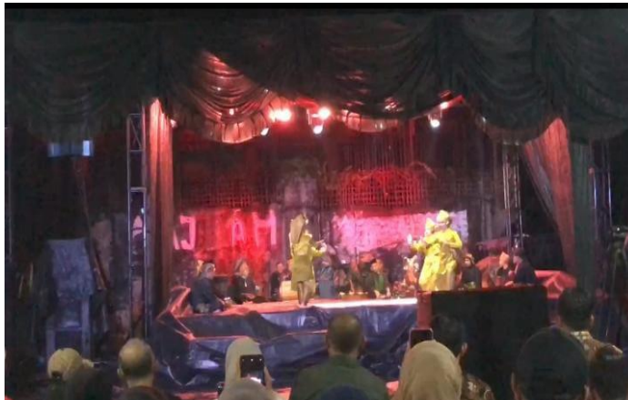
Gambar 1. Tempat pertunjukan Tari Buai-buai

Tari buai-buai seringkali ditampilkan di lapangan terbuka, dengan dua bentuk pentas terbuka yang umum digunakan, yaitu pentas arena dan proscenim . Namun, yang paling umum digunakan untuk menampilkan tari buai-buai adalah pentas arena, terutama pada malam hari. Dalam tari buai-buai, pentas menjadi sarana untuk menghidupkan cerita dan tema yang ingin disampaikan, sehingga penonton dapat menikmati keindahan dan makna dari tarian ini secara lebih mendalam.