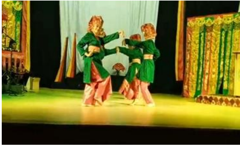
Gambar 3. Terlihat Penari Melakukan Gerak Malenggang Dokumentasi: Youtube 8 juli 2025

Gerakan malenggang adalah gerakan yang menggambarkan kehidupan sehari-hari petani yang sederhana dan penuh semangat. Setelah anaknya tertidur, petani berjalan ke halaman dan mengendarai kuda untuk pergi kesawah.