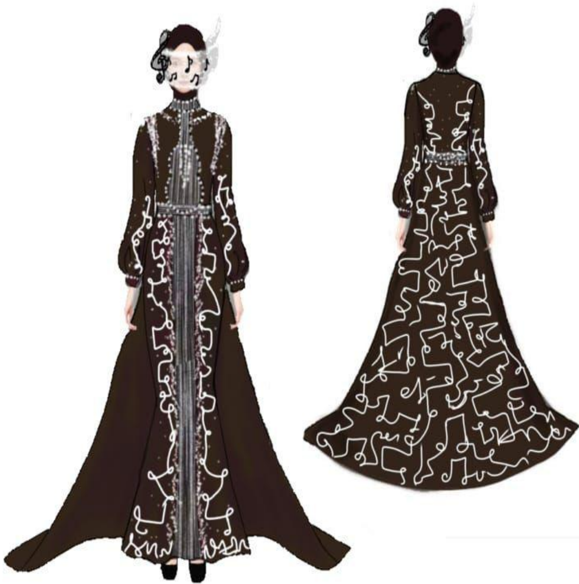
Gambar 3. Desain terpilih (Gambar : Khairah, 2025)