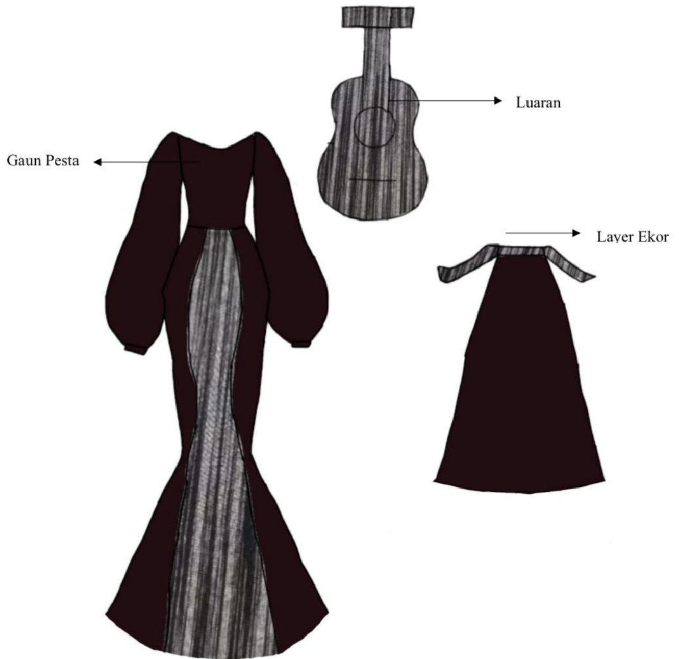
Gambar 4. Bagian busana