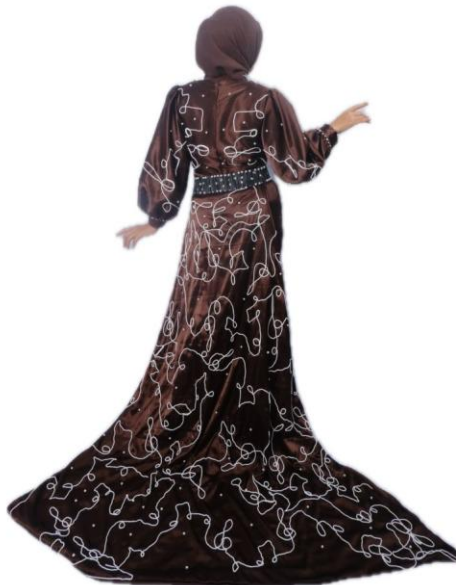
Gambar 6. Hasil busana Haute Couture belakang.