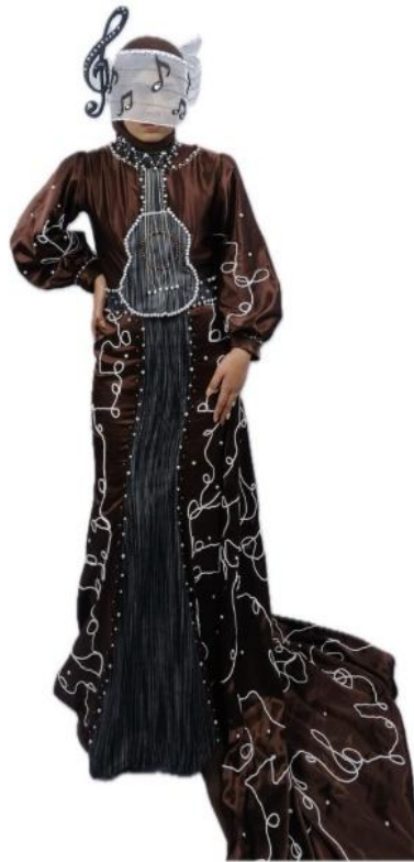
Gambar 5. Hasil busana Haute Couture