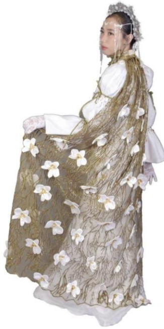
Gambar 6. Hasil busana Haute Couture belakang.

Gaun ini memiliki potongan lurus memanjang yang mempertegas bentuk tubuh, dilengkapi dengan rok lebar yang mengembang mulai dari lutut hingga ke bawah, menciptakan efek siluet yang megah. Warna dasar putih pada sisi luar memberikan kesan tenang namun kuat. Sementara jubah berwarna hijau pastel yang dihiasi dengan korsase bunga anggrek bulan menggunakan teknik korsase bernuansa monokrom menambah kesan romantis dan artistik. Bagian atasan gaun dirancang dengan lengan panjang mengembang bergaya puff dan detail kerut pada ujung lengan serta leher tinggi yang berkerut, menciptakan tampilan yang elegan dan bernuansa feminin.