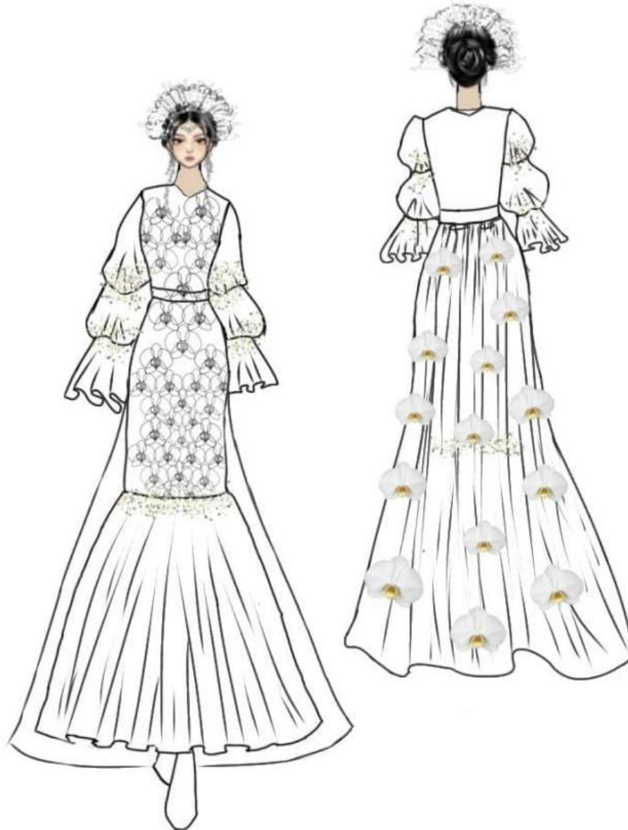
Gambar 2. Sketsa alternatif (Gambar : Emel, 2025)

Sketsa Alternatif merupakan tahap awal dalam penciptaan sebuah karya busana tahapan ini disesuaikan dengan moodboard