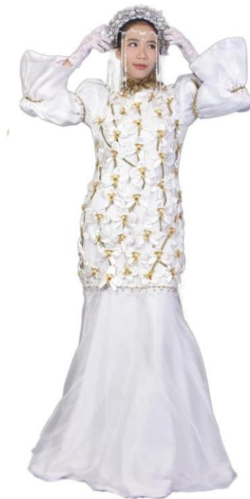
Gambar 5. Hasil busana Haute Couture