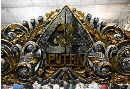
Logo Giri Harja 3 Putra