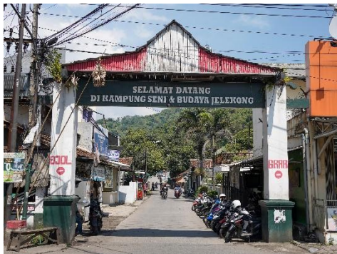
Kampung Seni dan Budaya Jelegong