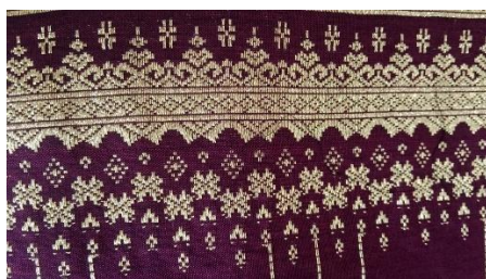
Gambar 3. Motif Palembang dengan Benang Emas pada Kain Tenun

Dokumentasi ini menunjukkan bahwa pola, warna, dan posisi motif Palembang biasanya itu ditempatkan dibagian tepi memperlihatkan bagaimana motif tersebut diterapkan secara konkret dalam konteks budaya. Bukti visual ini memperkuat temuan lapangan bahwa motif Palembang ini tidak hanya berfungsi estetis, tetapi juga simbolik dan sosial, sesuai dengan konteks penggunaannya dalam upacara adat dan kegiatan budaya di Pandai Sikek. Kain bermotif Palembang ini biasanya dipasarkan sebagai produk kerajinan khas yang memperkenalkan identitas budaya Pandai Sikek ke masyarakat yang lebih luas.