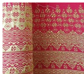
Gambar 1. Motif Palembang dengan Benang Emas pada Kain Tenun

Hasil observasi membuktikan bahwa pemilihan benang emas dan perak merupakan syarat penting dalam pembuatan tenun yang ada di Pandai Sikek. Setiap proses pengerjaannya, dimulai dari persiapan bahan sampai penyelesaian akhir, proses ini dilakukan dengan mengikuti aturan tradisional dan prinsip estetika budaya. Dokumentasi visual juga dilakukan untuk memperkuat hasil observasi, berikut hasil dokumentasi tenun songket dengan motif Palembang: