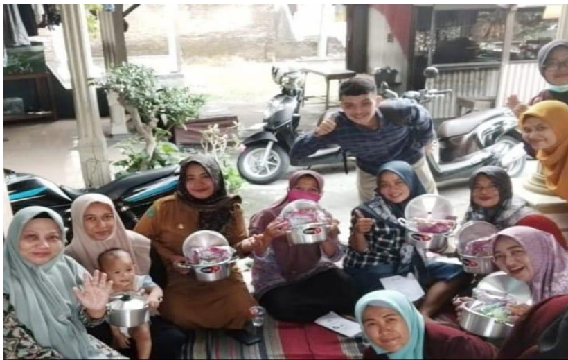
Gambar 2. Edukasi Sesi 2: demonstrasi menyusun menu makanan bervariasi sesuai pedoman "Isi Piringku".