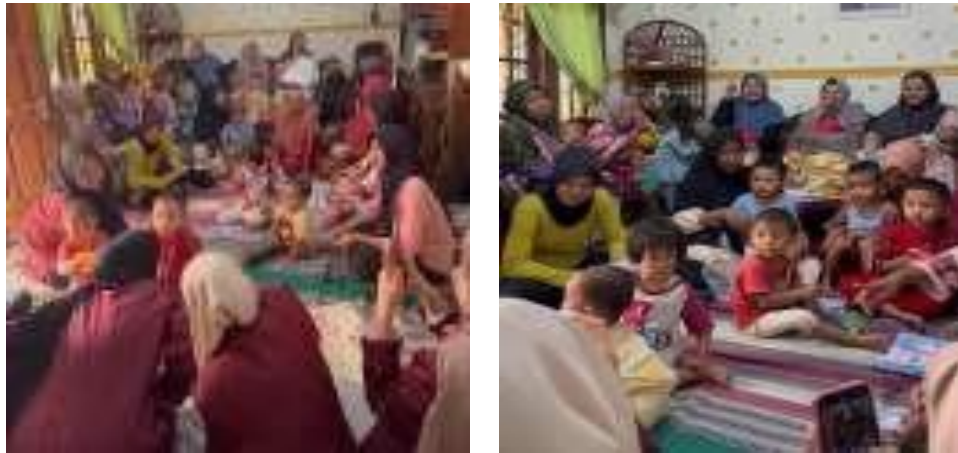
Gambar 1. Edukasi Sesi 1: komposisi makanan sesuai kebutuhan balita dalam sekali makan (Piring Makanku-Sajian Sekali Makan)