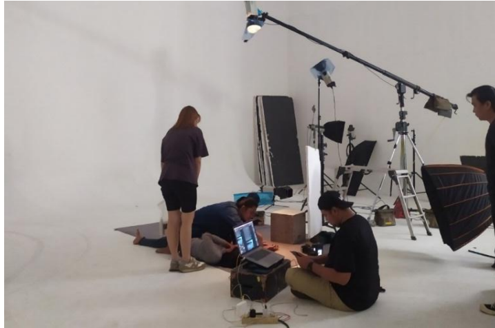
Gambar 6. Proses Foto Poster (Triana, 2023)

schedule, mempersiapkan pemain dan kebutuhannya, serta standby selama proses foto poster hingga selesai.