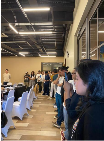
Gambar 9. Pre Production Meeting