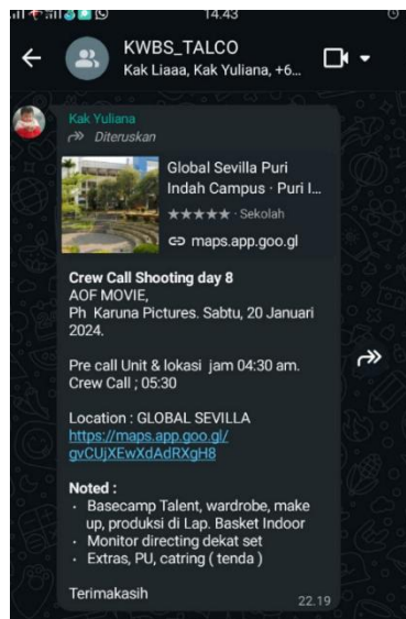
Gambar 2. Screenshoot Callsheet Pemain

Call Sheet pemain adalah lembar petunjuk kerja harian yang berisi informasi mengenai kegiatan produksi. Dokumen ini mencakup hal-hal yang berhubungan dengan pemain yaitu waktu dan tanggal, talent yang dibutuhkan, scene , serta alamat lokasi. Pada saat produksi, penulis bertugas untuk membuat callsheet untuk pemain dan menghubungi setiap manager dan pemain yang dibutuhkan setiap harinya, sehari sebelum shooting . Callsheet untuk pemain ini merupakan hasil breakdown dari callsheet yang telah di kirim astrada. Hal ini bertujuan untuk memberikan informasi kepada para pemain serta memastikan pemain datang tepat waktu sesuai yang tertera pada callsheet.