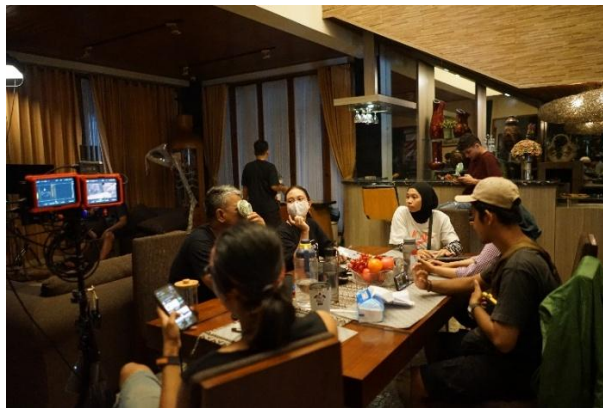
Gambar 5. Talco Standby Set

Stand by set adalah istilah yang mengacu pada tim dan peralatan yang selalu siap untuk digunakan jika terjadi perubahan mendadak atau kebutuhan tambahan selama proses produksi. Pada tahap ini setelah semua karakter dan extras memasuki set, penulis harus berada di lokasi syuting untuk bertanggung jawab mendampingi para pemain dan extras, mempersiapkan segala sesuatu yang dibutuhkan pemain pada saat syuting berlangsung, serta memastikan tidak ada pemain atau extras yang pergi dari set.