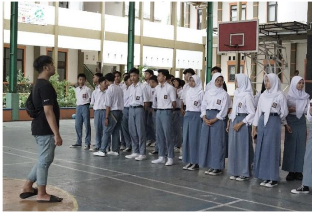
Gambar 4. Proses Koordinasi Extrass Sekolah