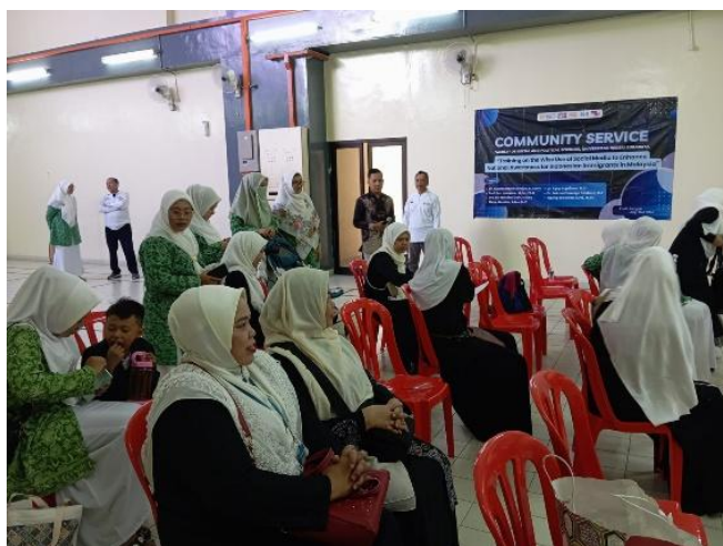
Gambar 2. Suasana workshop

Setelah mengikuti pelatihan, peserta menunjukkan sikap yang lebih reflektif terkait konten yang mereka unggah. Mereka memahami bahwa setiap unggahan mencerminkan identitas kebangsaan dan dalam konteks diaspora, konten positif dapat memperkuat citra Indonesia sebagai bangsa yang berbudaya dan bermartabat. Peserta juga menyadari bahwa media sosial dapat dijadikan ruang untuk menyuarakan nilai-nilai persatuan, toleransi, dan kebanggaan sebagai warga negara Indonesia.