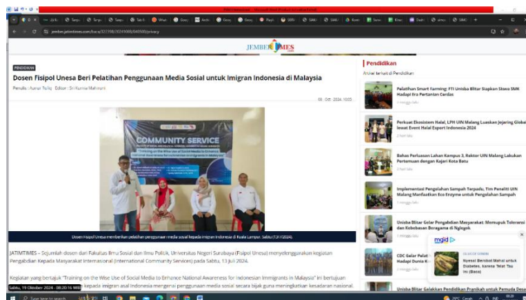
Gambar 5. Dokumentasi publikasi