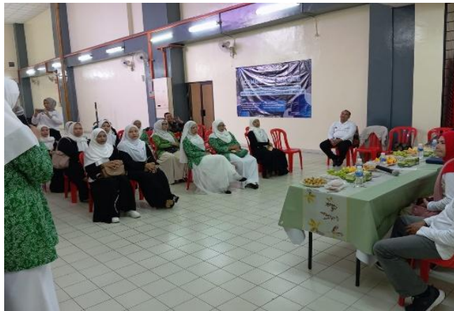
Gambar 1. Sesi materi workshop

Pelatihan ini berhasil memberikan fondasi pengetahuan yang lebih kuat kepada para peserta mengenai bagaimana media sosial dapat memberikan manfaat sekaligus risiko. Sebelum pelatihan, mayoritas peserta menggunakan media sosial secara spontan tanpa mempertimbangkan keamanan data pribadi, dampak sosial dari konten yang dibagikan, ataupun potensi misinformasi yang beredar. Melalui materi yang disampaikan, peserta mulai memahami pentingnya literasi digital dalam kehidupan sehari-hari.