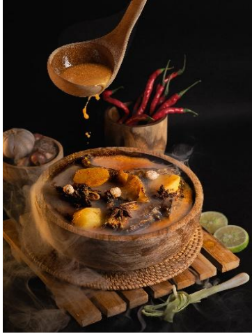
1. Ikan Sale