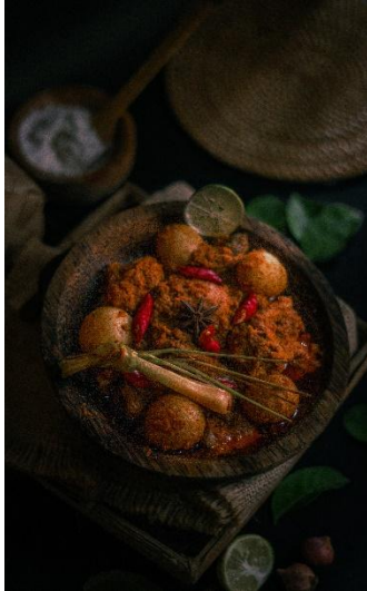
7. Rondang itik