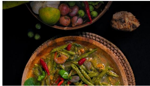
4. Gule Tauco