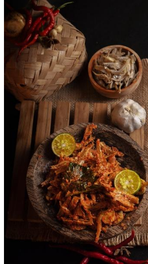
8. Sambal Ikan Tori Joruk