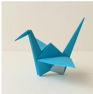
Gambar.4 Burung kertas origami