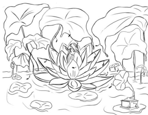
Gambar. 9 Sketsa ide 3 karya 4