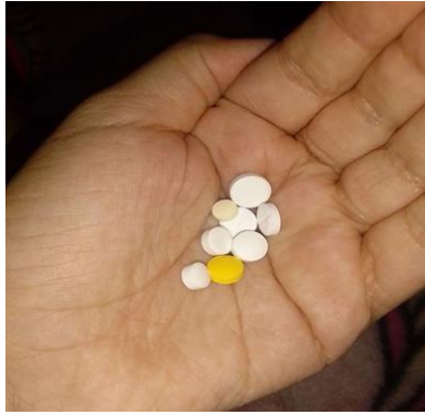
Gambar.5 Obat-obatan