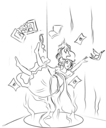
Gambar.7 Sketsa ide 3 karya 1