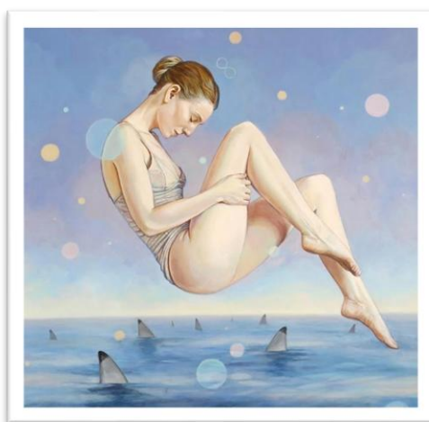
Gambar.4 "Breathe out the fears" Karya: Edith lebeu 20 x 20 Acrylic on wood 2020 (Sumber: @edith lebeu )

Pada karya yang akan digarap nantinya memiliki persamaan dalam merepresentasikan simbol kedalam bentuk-bentuk yang terdistorsi dan transformasi. Sedangkan, perbedaannya terlihat pada penggarapan karya dimana bentuk, dan visual yang akan dihadirkan dengan proses kreatif pengkarya. Seperti penggunaan skala bentuk yang membuat tampak harmonis dan selaras.