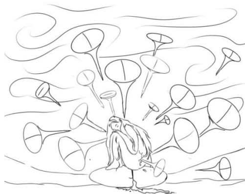
Gambar. 8 Sketsa ide 1 karya 2