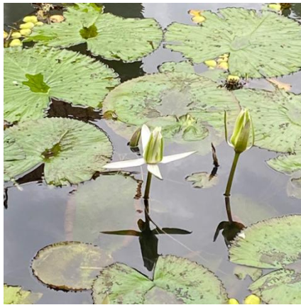
Gambar.6 Teratai