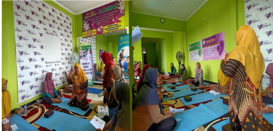
Gambar 1: Dokumentasi Kegiatan

Pelaksanaan Pengabdian Masyarakat tentang Edukasi Terapi Komplementer Pada Ibu, dilaksanakan pada tanggal 16 Juni 2023, bertempat di TPMB Diya A, S.Keb yang beralamatkan Dusun Kedondong Desa Blimbing Kecamatan Kesamben Kabupaten Jombang.